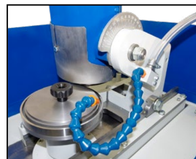
Affilatura controlama Sharpening counter blade Schärfen von Gegenmesser