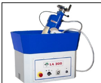
Allestimento standard Standard machine Standardausrüstung