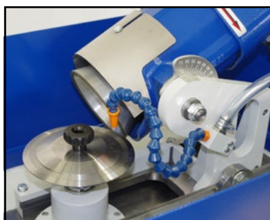
Affilatura lama circolare Sharpening circular blade Schärfen von Rundmesser